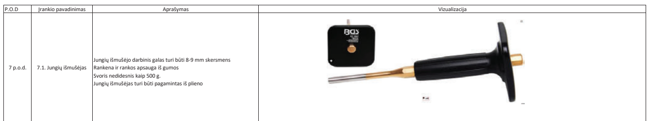
Techninės specifikacijos priedas Nr. 1 "Prekių specifikacija"